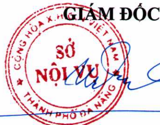
Võ Ngọc Đồng